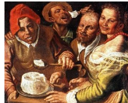
I mangiatori di ricotta