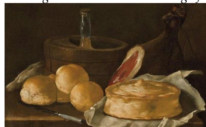
Natura morta con pani, prosciutto, casatiello...