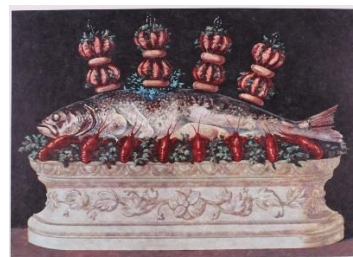
Les panaches panaches