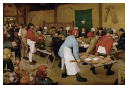
Le nozze contadine