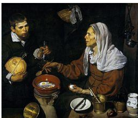
Vecchia che frigge le uova